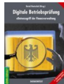
Digitale Betriebsprüfung - eDatenzugriff der Finanzverwaltung

Die GISA GmbH präsentiert sich auf dem 2. IQPC-Kongress "GDPdU Digitale Betriebsprüfung", vom 30. Mai