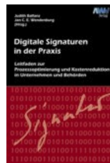
Digitale Signaturen in der Praxis