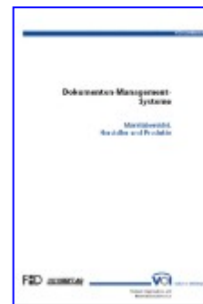
Marktüberblick: Dokumenten-Management- Systeme