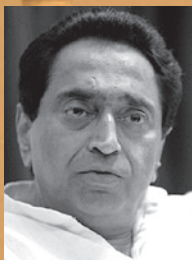
Kamal Nath , Indischer Handels- und Industrieminister

Keynote: Indien – Partner für den deutschen Mittelstand